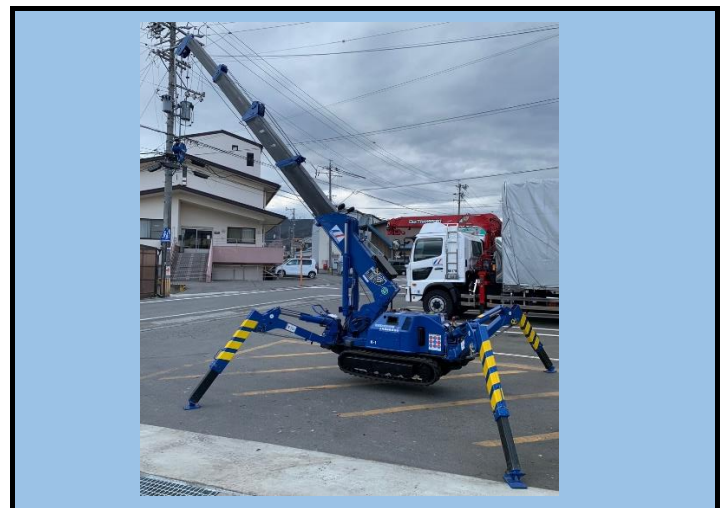
2.35t吊り カニクレーン