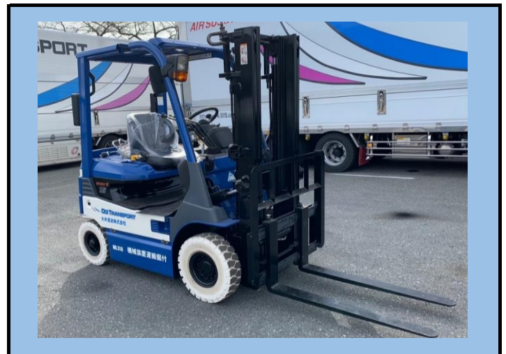
1.5tバッテリーフォークリフト