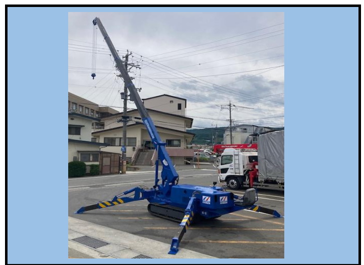
2.95t吊り カニクレーン