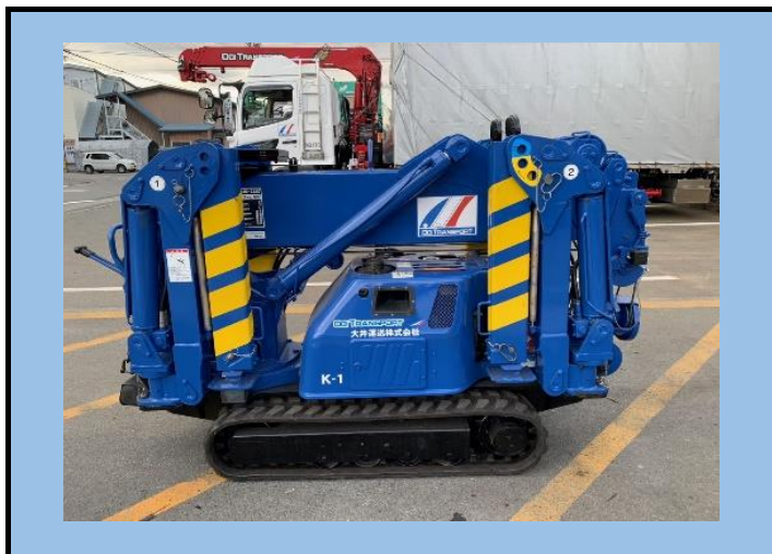
2.35t吊り カニクレーン