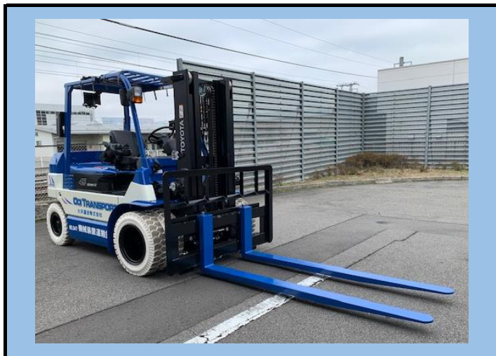
4.5tバッテリーフォークリフト