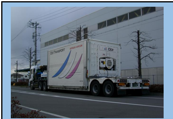
空調コンテナトレーラ No.2 (片側ウイング式開閉コンテナ)