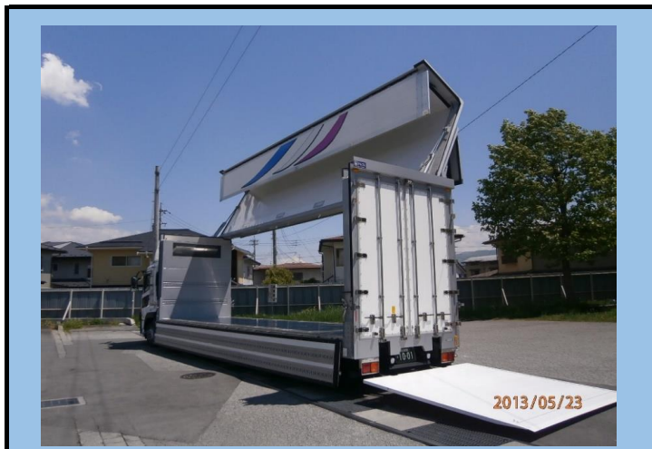
10t空調エアサスウイング車(オーバートーンウイング・上部開放9:1)