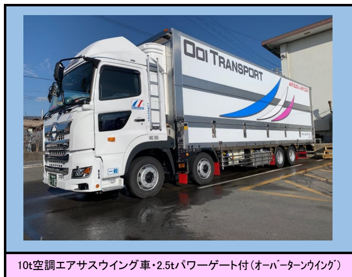
10t空調エアサスウイング車・2.5tパワーゲート付(オーバーターンウイング)