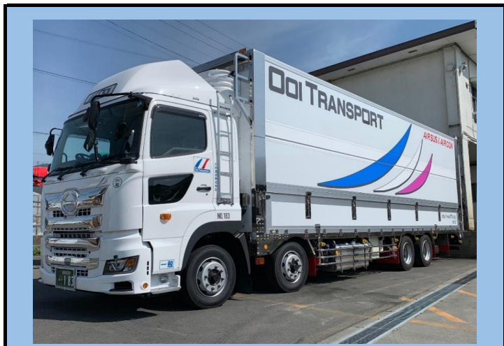
10t空調エアサスウイング車・2.5tパワーゲート付(オーバートーンウイング)