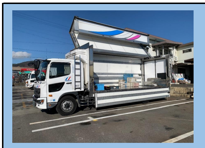
7t空調エアサスウイング車(オーバーターンウイング・上部開放7:3)