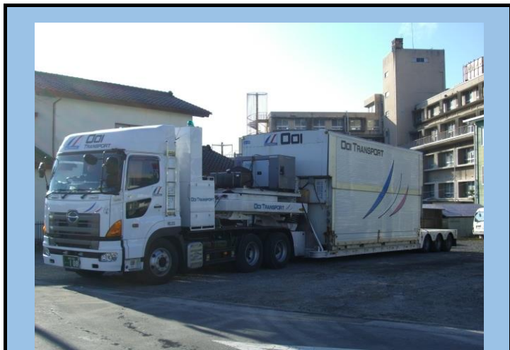
空調コンテナトレーラ No.1 (Wコンテナ・上部開放タイプ)