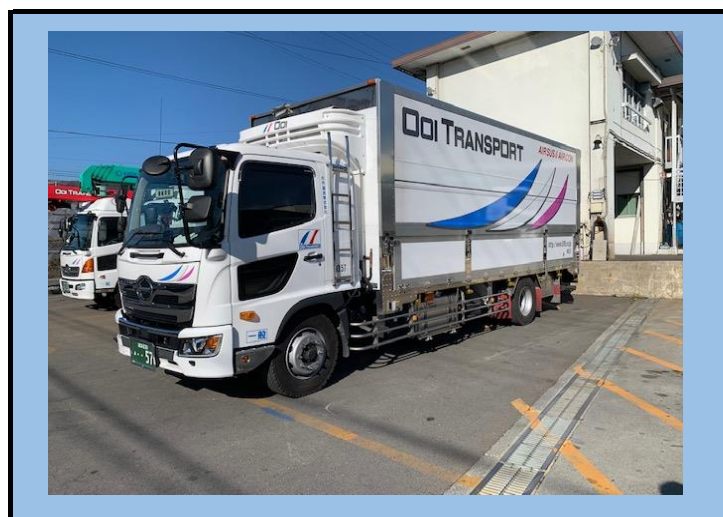
7t空調エアサスウイング車・2.5tパワーゲート付(オーバーターンウイング)