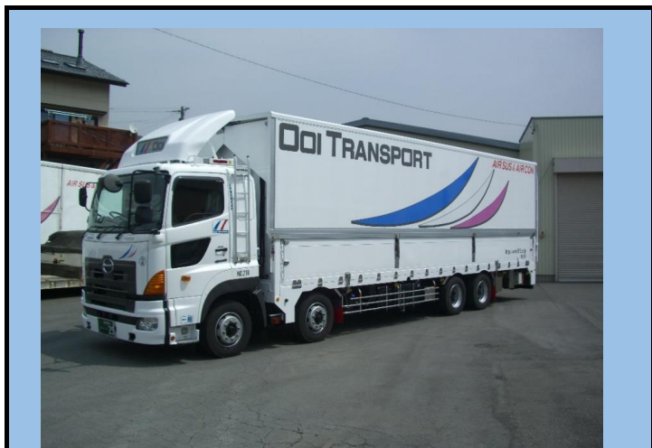
10t空調エアサスウイング車・2.5tパワーゲート付(ダブルウイング)