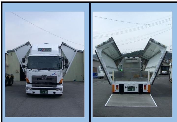
10t空調エアサスウイング車(ダブルウイング・オープントップ)