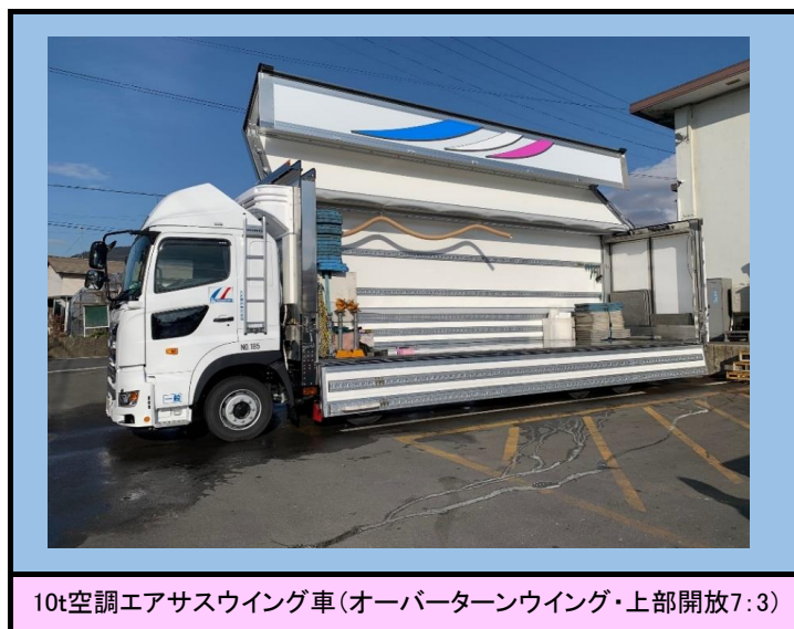
10t空調エアサスウイング車(オーバーターンウイング・上部開放7:3)